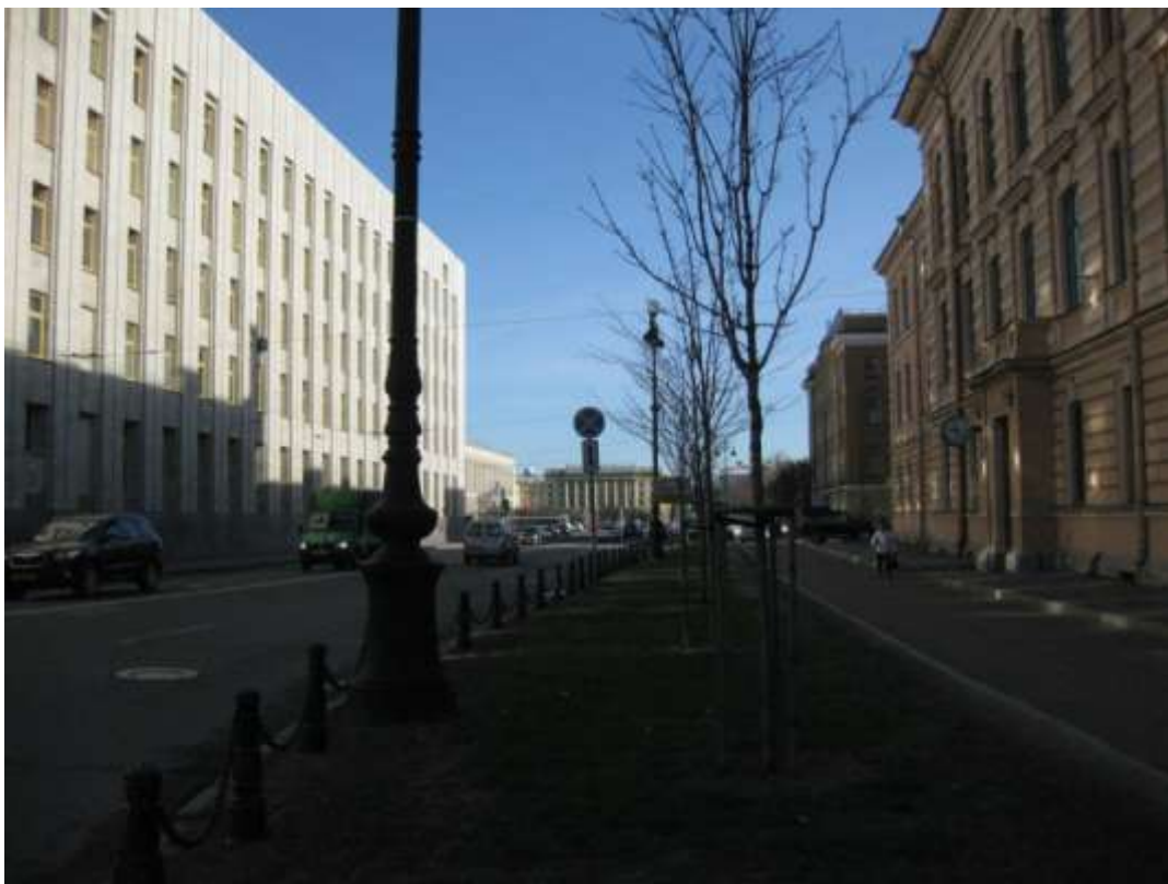
Фото 3. Вид на гимназию со стороны Лафонской ул. (Лафонская ул, д.1)