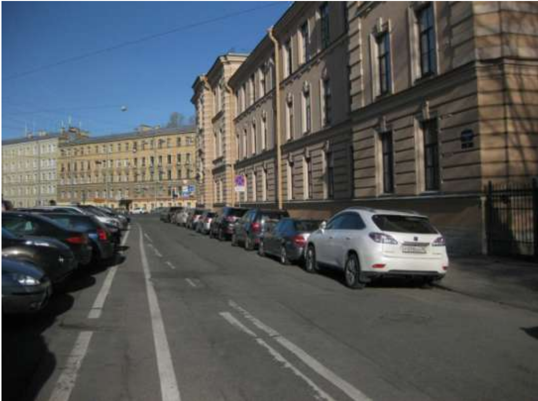
Фото 1. Вид на гимназию со стороны Смольного проспекта (Смольный проспект, д.2)