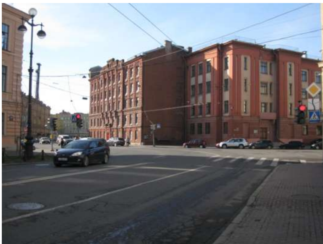
Фото 4. Перекресток со стороны Лафонской ул.