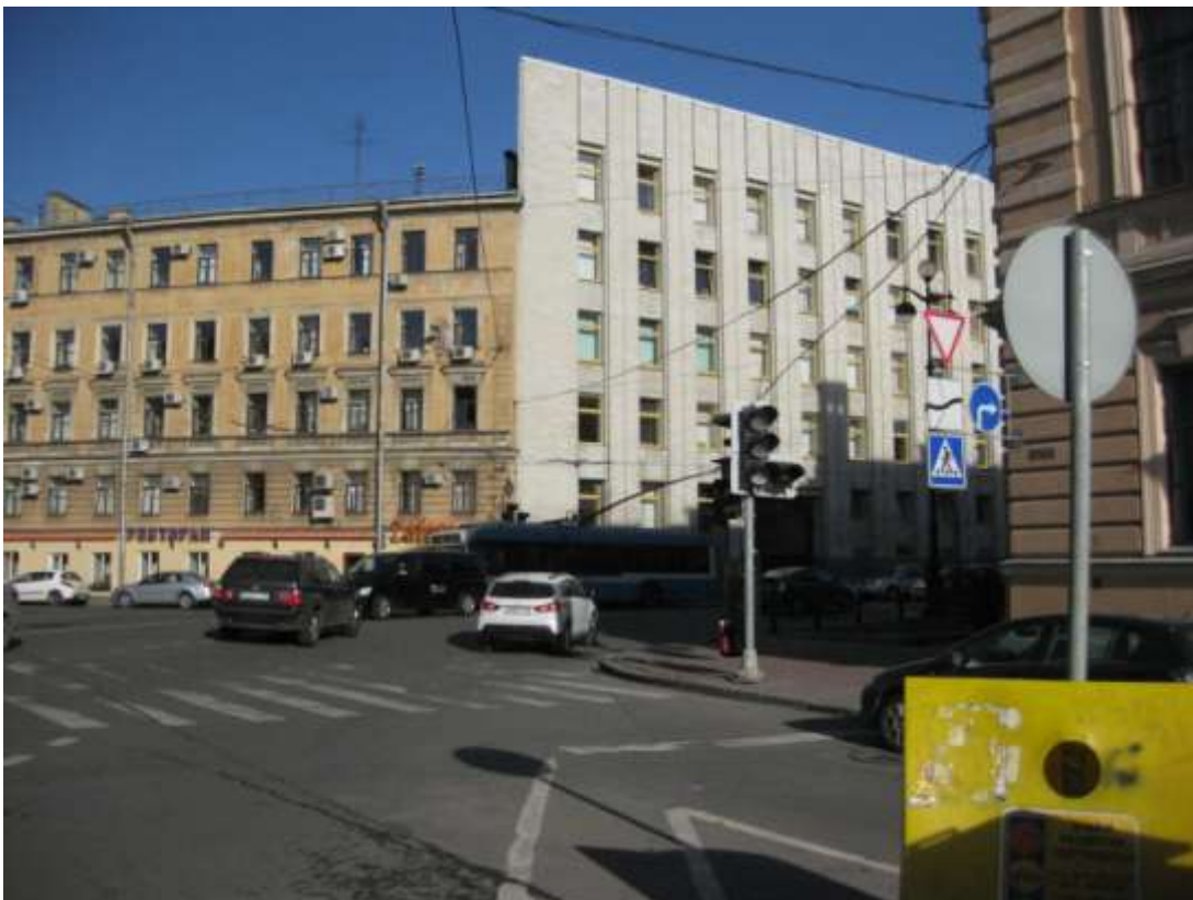
Фото 2. Перекресток Смольного проспекта, Лафонской ул. и Ярославской улицы